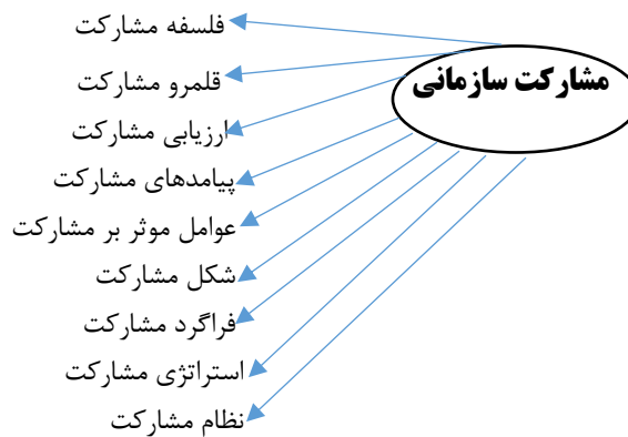
شکل ۲- مقوله های محوری مشارکت سازمانی